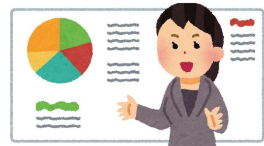
生成AIセミナーの講師